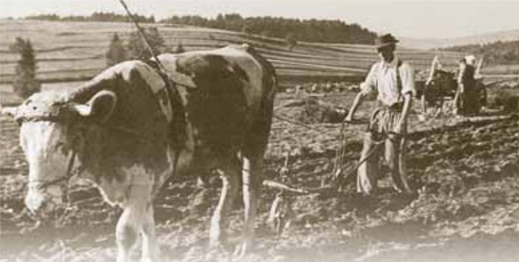
Der Bayerische Wald und die Oberpfalz 1889: